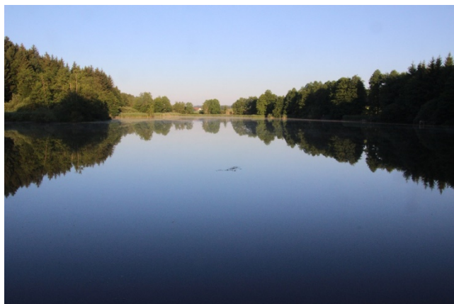
Still ruht der See