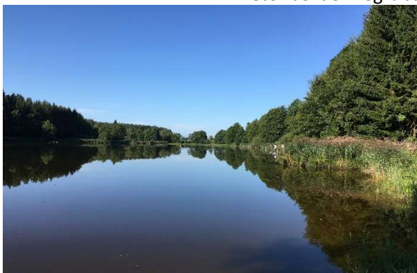
Wunderschönes Wetter in toller Natur